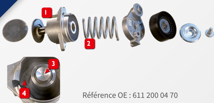
Référence OE : 611 200 04 70

Dans la nouvelle version, un axe en acier a été serti (photo repère 8), afin d'assurer un meilleur de centrage interne du ressort.