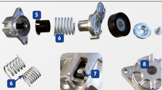
SWAG no. 10 92 6775 Référence OE : 646 200 05 70

For more technical information please visit: partsfinder.bilsteingroup.com