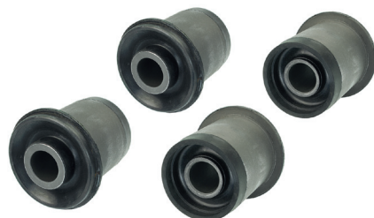
MEYLE-Nr.: 36-14 710 0001/HD