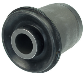
MEYLE-Nr.: 36-14 710 0000/HD