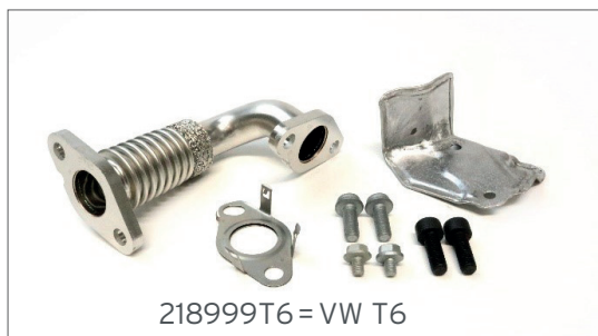
218999T6 = VW T6