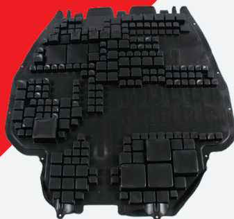
Motorafdekking met geluiddempende eigenschappen. Bijv. voor VW Golf IV febi 33543