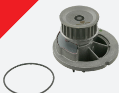
febi 24314 silniki 1,4l oraz 1,6l 16V