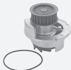
febi 18691 silnik 1,8l