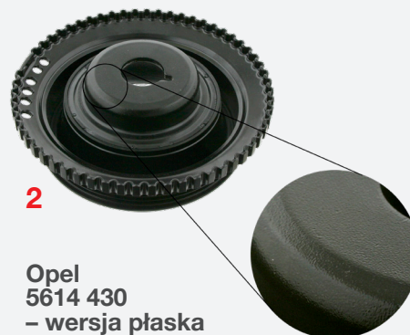
Opel 5614 430 – wersja płaska