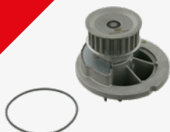
febi 24314 pour les moteurs 1,4 l et 1,6 l 16V

Dans tous les cas, il faut toujours remplacer la pompe à eau!