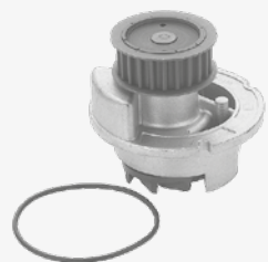
febi 18691 pour le moteur 1,8 l 16V