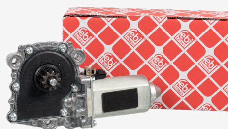
febi 35605 Motorino alzacristalli, lato sinistro