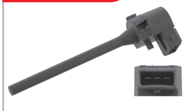
Capteur de niveau de liquide de refroidissement