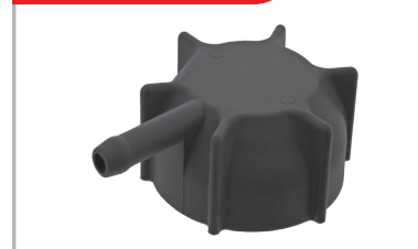
Bouchon de vase d'expansion

Découvrez la gamme complète et trouvez la pièce qu'il vous faut sur www.trucks.febi-parts.com