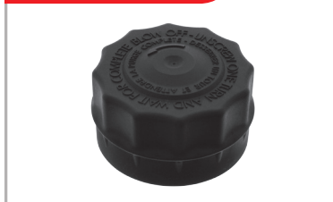
Bouchon de vase d'expansion