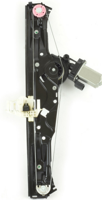
Oem window regulator - lève-vitre original - Fensterheber von oem - elevalunas original - levantator de vidro original - Γρύλος γνήσιος - alzacrystallo originale