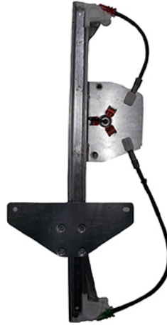
POWER WINDOW RIGHT ALZACRISTALLI ELETTRICO DESTRO

THIS INSTALLATION INSTRUCTION IS FOR BOTH LEFT AND RIGHT SIDE. CETTE INSTRUCTION DE MONTAGE EST POUR LES DEUX COTES DROIT ET GAUCHE. DIESE MONTAGE-ANLEITUNG IST FÜR DIE BEIDE LINKE UND RECHTE SEITE. ESTA INSTRUCCION DE MONTAJE ES PARA LOS DOS LADOS IZQUIERDO Y DERECHO. ESTAS INSTRUÇÕES VALEM TANTO PARA O LADO ESQUERDO QUANTO PARA O DIREITO. LA PRESENTE ISTRUZIONE VALE SIA PER IL LATO SINISTRO CHE PER IL LATO DESTRO.