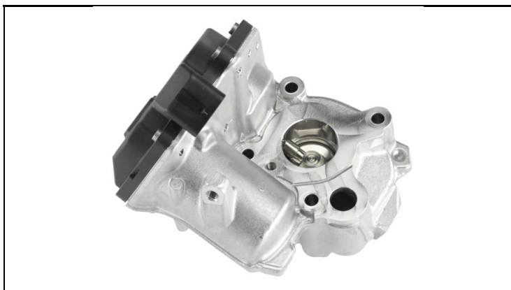
1 - Produkt / Product