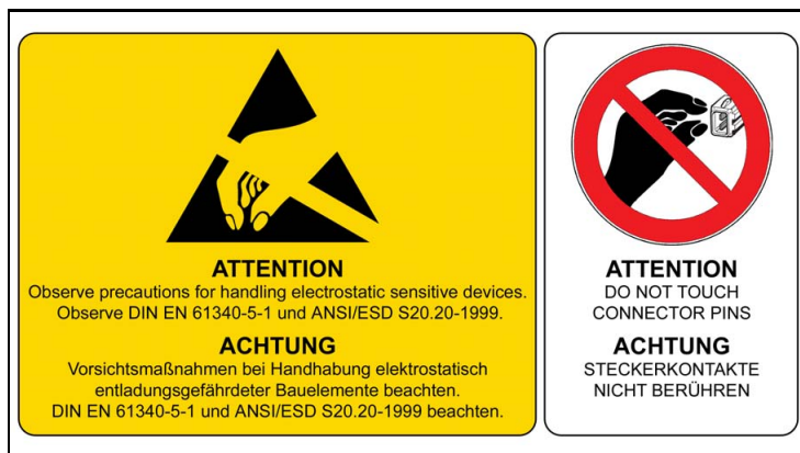
4 - ESD Hinweise / ESD Notes