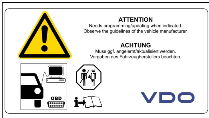
3 - Montage Hinweise / Installation Notes

Nennspannung (Positionssensor) / Nominal Voltage (Position Sensor) = 5 V