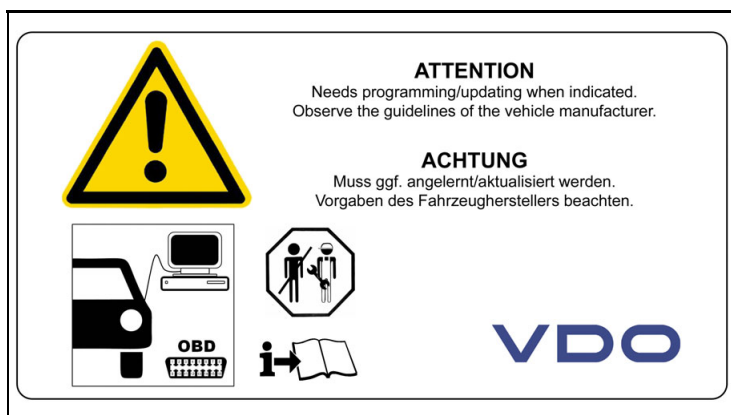
3 - Montage Hinweise / Installation Notes

Nennspannung (Positionssensor) / Nominal Voltage (Position Sensor) = 5 V