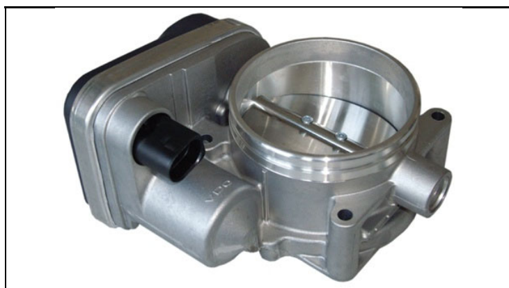
1 - Produkt / Product