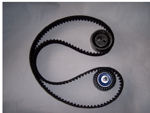
Nieuwe inhoud SKF VKMA 03244/03247

© SKF is een geregistreerd handelsmerk van de SKF Groep.