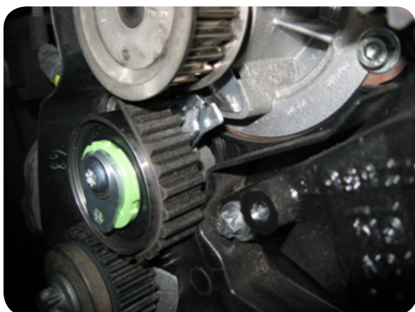
2. sz. kép