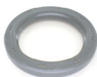
Joint d'étanchéité à l'huile