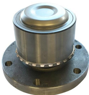
4. Vzmetna podložka v ustrezni poziciji.