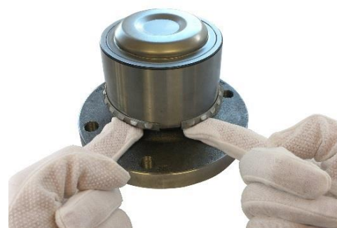
3. Potisnite jo nazaj v pravo pozicijo na kolesnem ležaju.