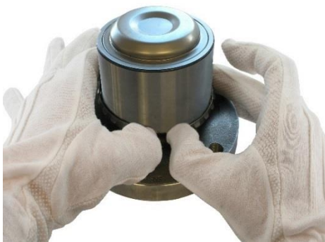
2. Razmaknite vzmetno podložko.