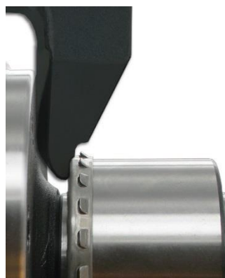
5. Za namestitev kolesnega ležaja uporabljajte SKF montažno orodje VKN 600.

Kliknite za ogled SKF tehničnih videov na kanalu YouTube!