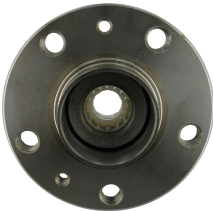
Lagereinheit mit Sicherungshülse

SKF-Lagereinheiten sind mit einer Sicherungshülse versehen, um die Radlagereinheiten während des Transports und der Montage zu schützen. VKBA 1435 wird z. B. mit einer Sicherungshülse geliefert, um die beiden Innenringe in Position zu halten, bis die Radlagereinheit am Fahrzeug montiert ist.