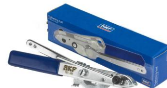
Pince de serrage : VKN 400