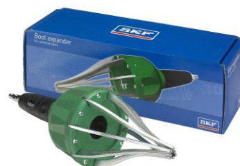
Ecarteur de soufflet : VKN 402

Un serrage incorrect des colliers peut provoquer une usure prématurée du joint homocinétique !