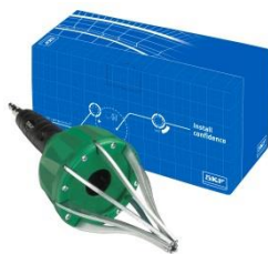
Alat za montažu manšeta: VKN 402

Za profesionalni popravak preporuča se upotreba SKF-ovog VKN 400 alata za pritezanje obujmice.