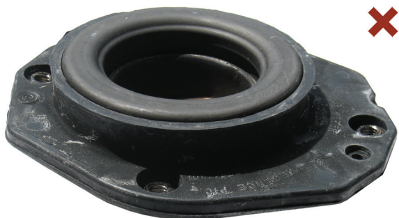
Fig. 1: Napačno montiran oporni ležaj vzmetne noge

Citroën Berlingo / Xsara / ZX Peugeot 306 / Partner