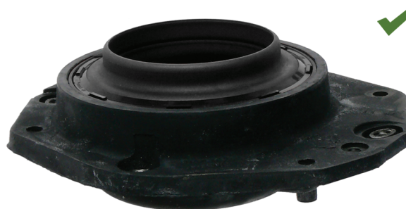
Fig. 2: Pravilno montiran oporni ležaj vzmetne noge