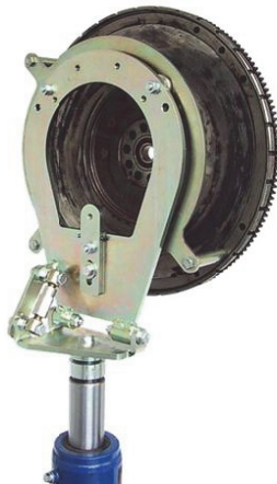
Obr. 2: Adaptér pre dvojhmotový zotrvačník Blitz Rotary obj. č. 3745430