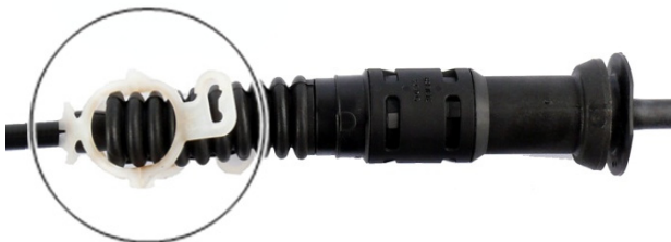
Kuva 5: Varmistin avattuna

→ Vaijeri säätyy automaattisesti kytkinpolkimen painalluksen mukaan.