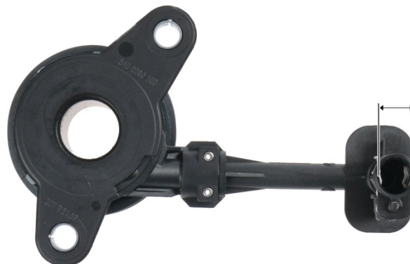
Fig. 4 : CSC 3182 600 140 → 3182 654 204 Diamètre du raccord hydraulique : 12,2 mm

Veuillez considérer que les raccords hydrauliques des butées ne sont pas représentés à l'échelle.