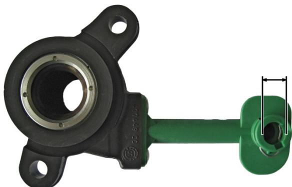
Fig. 1 : CSC 3182 600 121 → 3182 654 165 Diamètre du raccord hydraulique : 11,7 mm