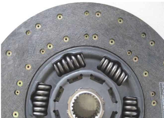
Fig. 3: Garniture côté boîte de vitesses

La garniture côté boîte de vitesses (Fig. 3) est d'abord collée sur une plaque de support.