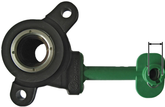
Abb. 1: CSC 3182 600 121 → 3182 654 165 Durchmesser Hydraulikanschluss 11,7 mm