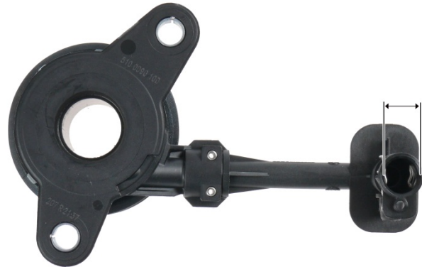
Abb. 4: CSC 3182 600 140 → 3182 654 204 Durchmesser Hydraulikanschluss 12,2 mm

Hydraulikanschlüsse der Ausrücker sind nicht maßstabgerecht abgebildet.