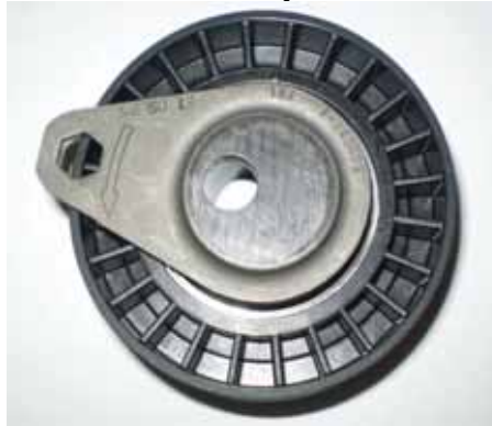
Fig. 2 Nouvelles technique de galets tendeurs