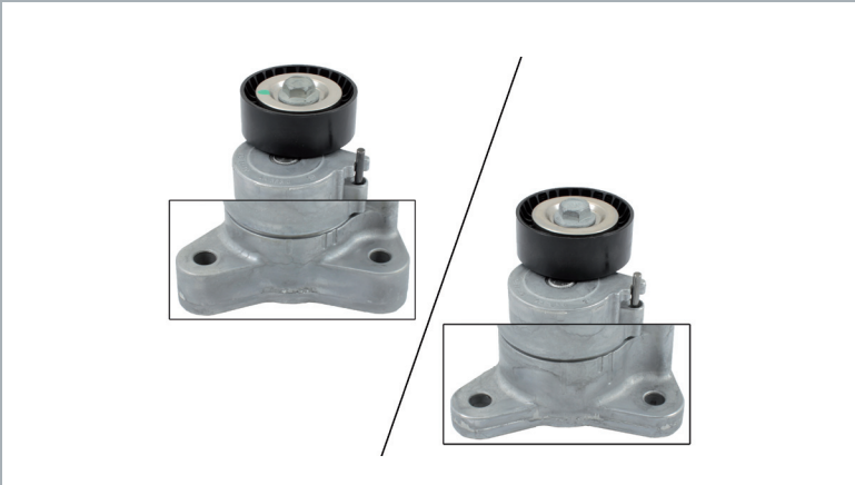
Bild 3: Links, alte Ausführung mit breiten Befestigungspunkten. Rechts, neue Ausführung mit schmalen Befestigungspunkten.

Zusätzlich sind die Befestigungspunkte der neuen Ausführung im Vergleich zur Alten um 10 mm schmaler. Bei der modifizierten Ausführung beträgt die Breite der Befestigungspunkte 12 mm (Bild 3, rechts), bei der alten Variante sind es 22 mm (Bild 3, links).