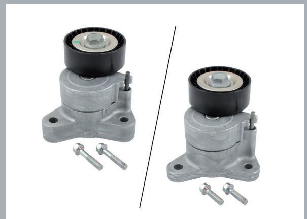
Bild 1: Spannarm 56653 – Links, alte Ausführung mit Befestigungsschrauben. Rechts, neue Ausführung mit Befestigungsschrauben.

Bei aufgelegtem Keilrippenriemen und gezogenem Arretierstift muss sich die Markierung am Hebel (M, Bild 2) in etwa im Bereich der Nominalposition (N, Bild 2) befinden. Bei laufendem Motor bewegt sich die Markierung des Hebels im Arbeitsbereich zwischen A1 und A2 (Bild 2).