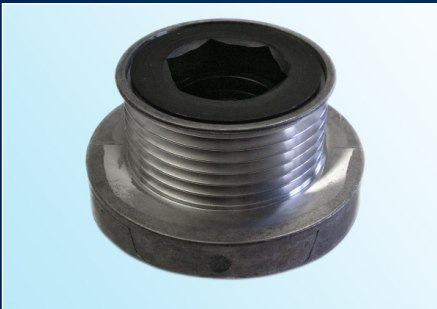
Bild 1: Schwingungsdämpfer 77 00 110 616

Bei defektem Schwingungsdämpfer (OE-Nr. 77 00 110 616) ist dieser durch einen Generatorenfreilauf auszutauschen. Den Generatorenfreilauf erhalten Sie bei RUVILLE unter der Artikel-Nr. 55627.