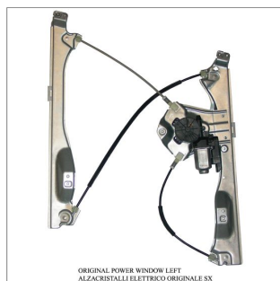
ORIGINAL POWER WINDOW LEFT ALZACRISTALLI ELETTRICO ORIGINAL SX

Lève-vitre d'origine / Original-Fensterheber Alzacristalli originale / Elevavinas original