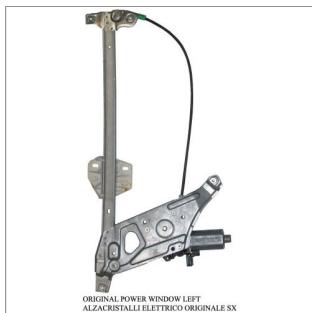
ORIGINAL POWER WINDOW LEFT ALZACRISTALLI ELETTRICI ORIGINALE SX

Lève-vitre d'origine / Original-Fensterheber Alzacristalli originale / Elevallunas original