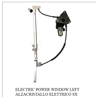
ELECTRIC POWER WINDOW LEFT ALZACRISTALLO ELETTRICO SX

Lève-vitre de remplacement / Ersatz-Fensterheber Alzacristalli di ricambio / Elevallunas de recambio