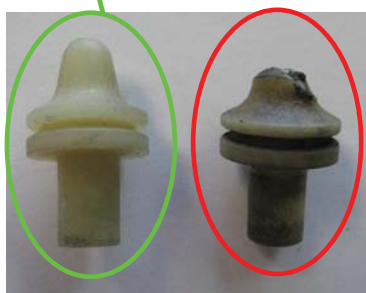
Az elhasználódott villával összevetve állítsa be a villát