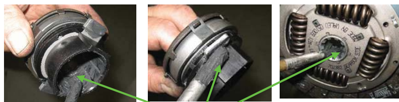
Használjon kismennyiségű zsírt