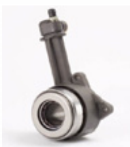
Υδραυλικό ρουλεμάν Transit Κωδικός Valeo 804508

Αντικαταστήστε το υδραυλικό ρουλεμάν , ακόμα κι αν η κατάστασή του φαίνεται καλή. Προλάβετε έτσι ενδεχόμενη αστοχία του μετά από λίγα χιλιόμετρα (διαρροή). Κωδικός υδραυλικού ρουλεμάν Valeo 804508 .