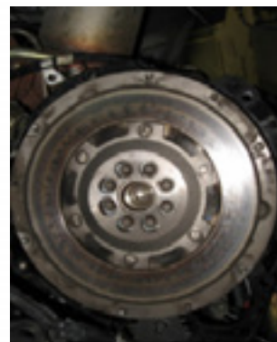
Βολάν 2 μαζών Transit Connect