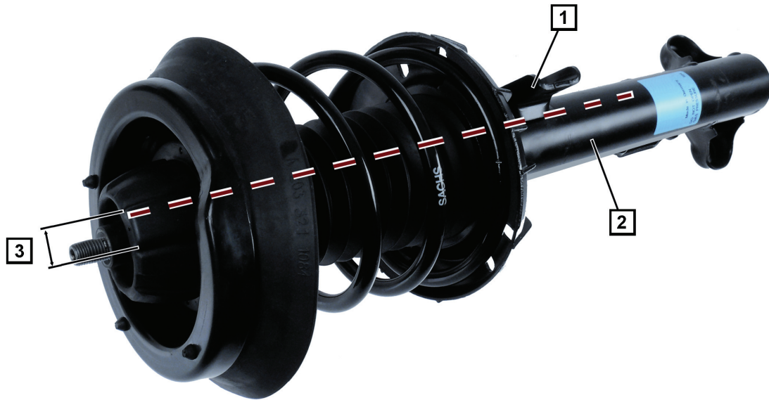
Fig. 1: Federbein

Mercedes-Benz C-Klasse (CL203 / S203 / W203) Mercedes-Benz CLK-Klasse (A209 / C209) Art.Nr. 87-731-A