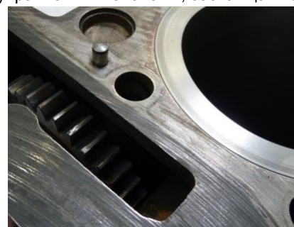
Уплотняемые поверхности моторного блока с цилиндрическим зубчатым колесом

цилиндрических зубчатых колес в головке цилиндров и моторном блоке, (см. рисунки) делает необходимым, чтобы материал, снятый при машинной обработке уплотняемой поверхности, был компенсирован при помощи более толстой ремонтной прокладки ГБЦ.