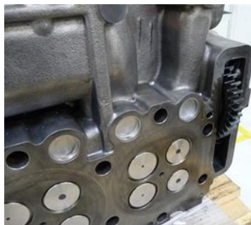
Surface d'étanchéité de la culasse avec pignon droit

Au bout d'un certain temps d'utilisation ou suite à un dommage, le moteur peut voir son fonctionnement se dégrader considérablement. Il faut alors le réparer. Le rétablissement des mécanismes de fonctionnement complexes mis au point par le fabricant exige de disposer d'un bagage technique complet. Ainsi, il faut par exemple contrôler soigneusement l'état des surfaces d'étanchéité du bloc-moteur et de la culasse avant chaque étape de travail. La remise en état optimale de ces composants nécessite souvent des retouches mécaniques précises des surfaces d'étanchéité. Cette opération doit être confiée à une entreprise spécialisée disposant à la fois du parc de machines