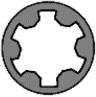
111.590 M 9x1,25x87

Schraubenkopf / Head shape Anziehreihenfolge/Tightening sequence/Ordre de serrage/Orden de apriete Tête de vis / Cabeza de tornillo