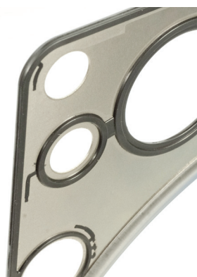
61-34285-20_Плоская резиновая кромка