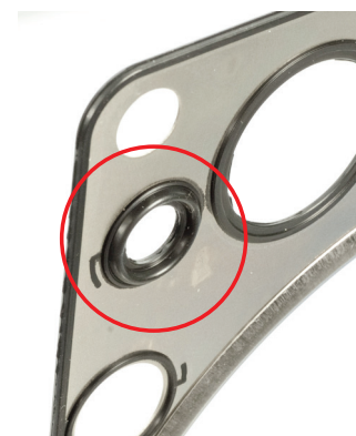
61-37770-00_На 3мм более высокая резиновая кромка