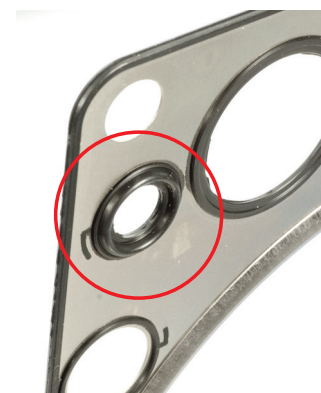
61-37770-00_Uszczelka gumowa wyższa o 3 mm