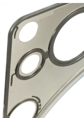
61-34285-20_Płaska uszczelka gumowa