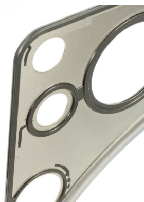
61-34285-20_Plano del labio obturador de goma