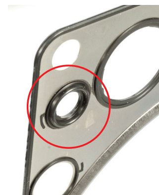
61-37770-00_Labio obturador de goma 3mm más alto