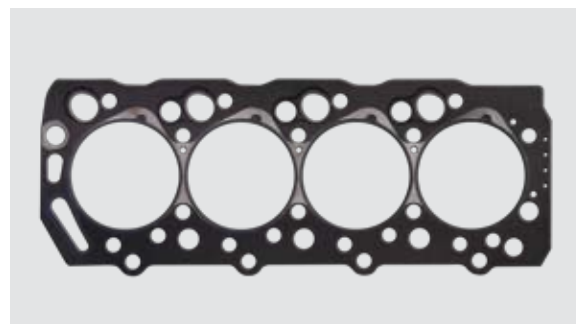
Fig. 1_61 -52252-00 (TC vecchio tipo)

→ La serie smerigliatura 02-52252-01 (con TC) viene sostituita dalla 02-52252-02 (senza TC).