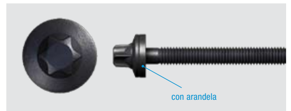
Figura 1_Tornillo antiguo / sustituido con arandela (N° orig. 607 926)

Opel ha sustituido el tornillo de culata con arandela imperdible y número original 607 926, por el número original 56 07 937 sin arandela. El nuevo tornillo es algo más corto, por lo que se debe montar sin arandela. A partir de ahora, al realizarse una reparación, si desmonta el tornillo "antiguo" con arandela, se deberá montar el nuevo tornillo sin arandela.