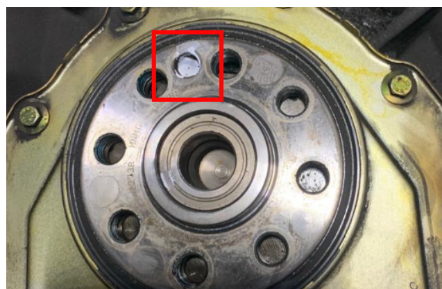
Obrázek 2: Referenční značka na klikové hřídeli

Výše uvedené dvoumotové setrvačnický jsou vybaveny senzorovými prstenci, které používá řídicí jednotka motoru ke snímání polohy klikové hřídele. Při montáži je nutné dbát na to, aby proti sobě ležely referenční značka dvoumotového setrvačnicku (malý otvor, obr. 1) a značka na klikové hřídeli (otvor, obr. 2). Motor nelze spustit, pokud se dvoumotový setrvačnick namontuje ve špatné poloze.