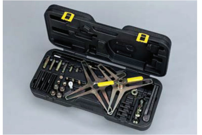
Resim 2: Debriyaj onarımı için 400 0237 10 özel servis takımı

Araç üreticisinin teknik özelliklerine uyunuz!