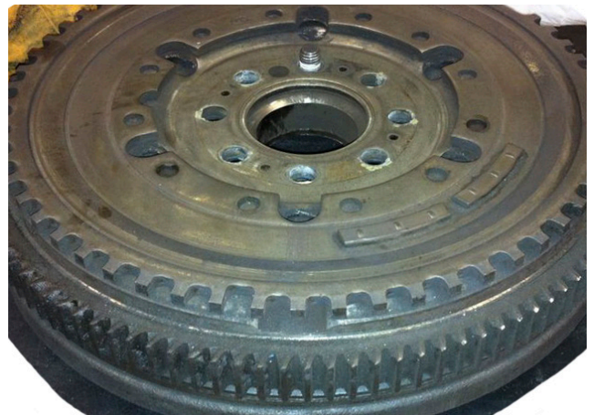
Εικόνα 1: Έκδοση έως 03/2012

Στα πλαίσια της συνεχούς εξέλιξης των προϊόντων μας, ο δακτύλιος αισθητήρα και η διάταξη ρουλεμάν του βολάν διπλής μάζας (ΒΔΜ) 415 0560 10 έχει τροποποιηθεί.