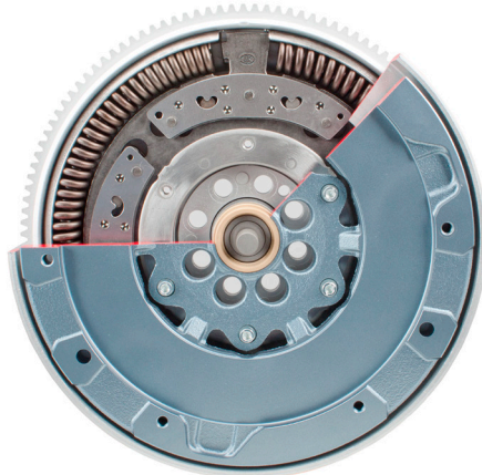
איור 1: גלגל תנופה כפול מסה בעל מנגנון שיכור מסוג מטוטלת שיכור צינרפוגלית.

LuK גלגל תנופה כפול: 415 0450 10 415 0477 10 415 0499 10 415 0554 10