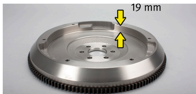
Billede 1: OE-nr. 90536140/616169 uden hulning i periferi; svinghjulets dybde: 19 mm