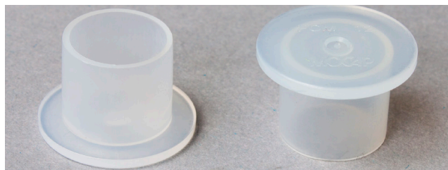
Obrázek 2: Uzavírací zátka