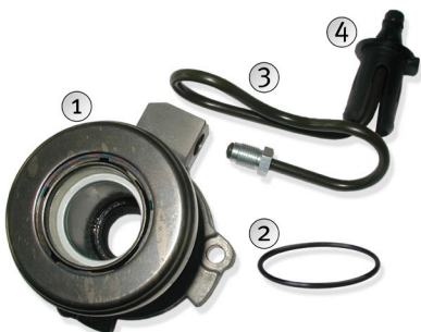
Рисунок 1: Снимите и утилизируйте все компоненты

Рисунок 1: Удалите следующие детали и убедитесь, что они выбраны верно: Изношенный CSC (1), уплотнение на фланце корпуса трансмиссии (2), соединительную трубку (3) и пластиковую муфту (4) используемую для фиксации трубки в корпусе трансмиссии.