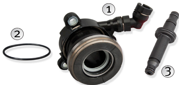
Рисунок 2: LuK CSC 510 0073 10 актуальная конструкция

Необходимо знать несколько важных рекомендаций при установке деталей для сохранения максимального ресурса и надежности. Пожалуйста учтите, что актуальная конструкция LuK CSC может отличаться от предшествующей конструкции CSC № 510 0073 10. Если это тот самый случай, то система выключения сцепления должна быть модернизирована.