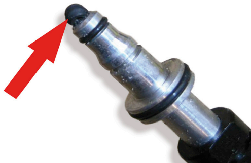
Рисунок 4: Если старое уплотнение не снять, то его вдавливают в новый CSC и блокирует трубку