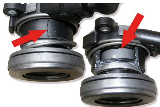
Рисунок 5: CSC поврежден в результате неправильной установки

Система должна быть заполнена при замене CSC. Заполнение систем жидкостью состоит из двух отдельных процессов: заполнение системы выключения сцепления и промывка CSC.