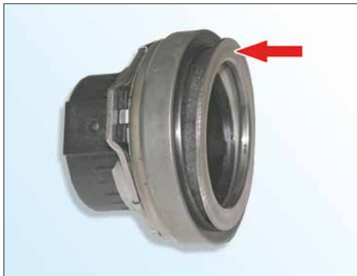
Slika 1: 500 0035 10