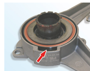
Fig. 3: Corect